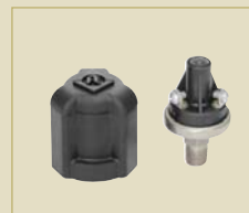
Detalhe do Sensor

Motobomba multiestágios, acoplada ao inversor de frequência, fornecida com 3 estágios.