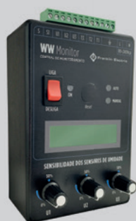
Central de monitoramento para proteção de motobombas submersíveis.