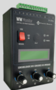
Central de monitoramento para proteção de motobombas submersíveis.